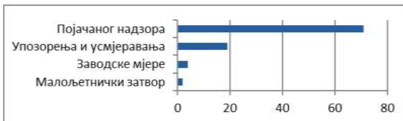
Графикон 3. Изречене кривичне санкције, 2017. година Graph 3. Criminal sanctions imposed, year 2017