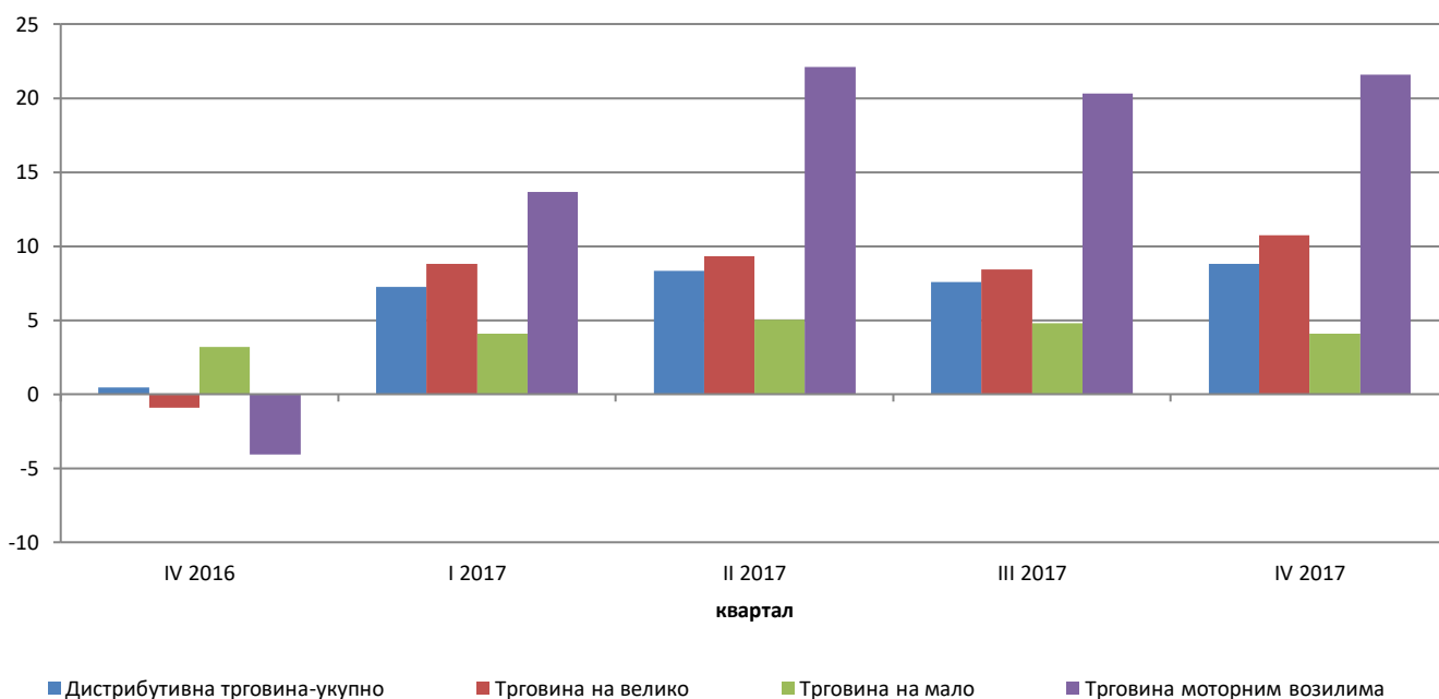
Годишње стопе промјене дистрибутивне трговине, календарски прилагођена серија

У структури оствареног промета укупне трговине (изворни, неприлагођени подаци) највеће учешће остварено је у трговини на велико (56,8%), потом слиједе трговина на мало (37,1%), те трговина и одржавање моторних возила и мотоцикала (6,1%).