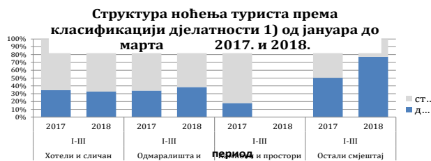
Табела 3 : Доласци и ноћења туриста према класификацији дјелатности 1)