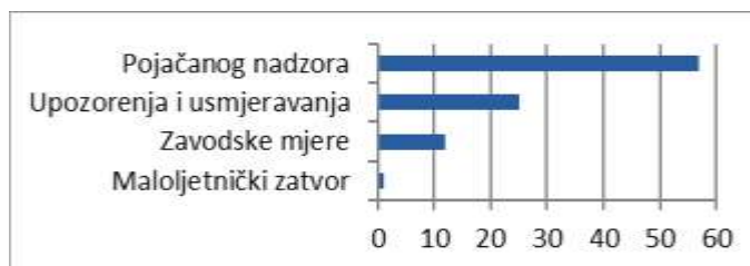
Grafikon 3. Izrečene kaznene sankcije, 2018. godina Graph 3. Criminal sanctions imposed, year 2018