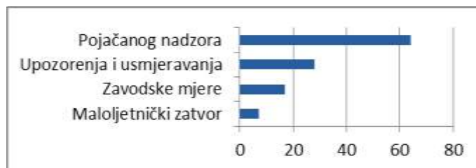
Grafikon 3. Izrečene kaznene sankcije, 2019. godina Graph 3. Criminal sanctions imposed, year 2019