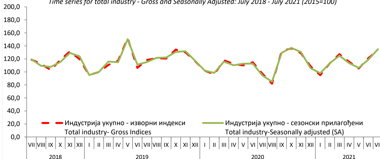
Временска серија индустрија укупно - изворни и сезонски прилагођени: јул 2018 - јул 2021 (2015 = 100) Time series for total industry - Gross and Seasonally Adjusted: July 2018 - July 2021 (2015=100)

Main Industrial Groups: In July 2021, compared to July 2020, production of Consumer non-durables increased by 57.7%, production of Intermediate goods increased by 39.4%, production of Capital goods increased by 25.9%, production of Consumer durables increased by 18.4%, and production of Energy increased by 12.1%.