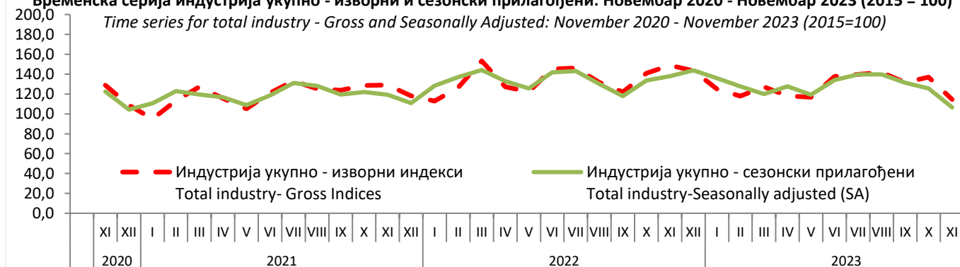
Временска серија индустрија укупно - изворни и сезонски прилагођени: Новембар 2020 - Новембар 2023 (2015 = 100) Time series for total industry - Gross and Seasonally Adjusted: November 2020 - November 2023 (2015=100)

Main Industrial Groups: In November 2023, compared to November 2022, production of Intermediate goods decreased by 45.7%, production of Consumer non-durables decreased by 23.6%, production of Energy decreased by 6.2%, production of Consumer durables decreased by 5.0%, and production of Capital goods decreased by 0.3%.