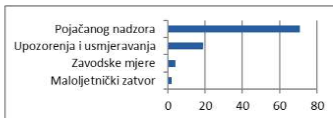
Grafikon 3. Izrečene kaznene sankcije, 2017. godina Graph 3. Criminal sanctions imposed, year 2017