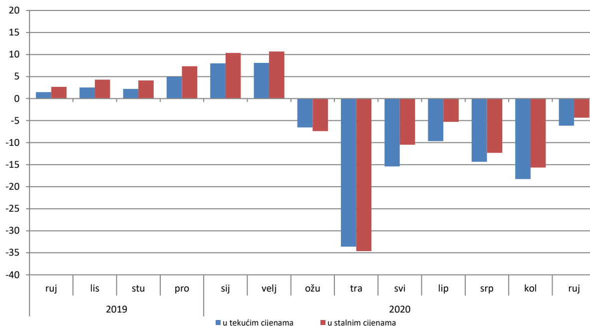
Godišnje stope promjene trgovine na malo, kalendarski prilagođena serija BiH

U odnosu na baznu (2015) godinu, realni indeks prometa prehrambenim proizvodima u rujnu 2020. godine ostvario je rast od 27,8% dok je promet neprehrambenim proizvodima ostvario rast od 30,7%. Promet od trgovine na malo motornim gorivima zabilježio je pad od 5,7%.