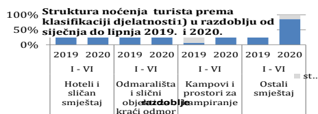
Tabela 3 : Dolasci i noćenja turista prema klasifikaciji djelatnosti 1)