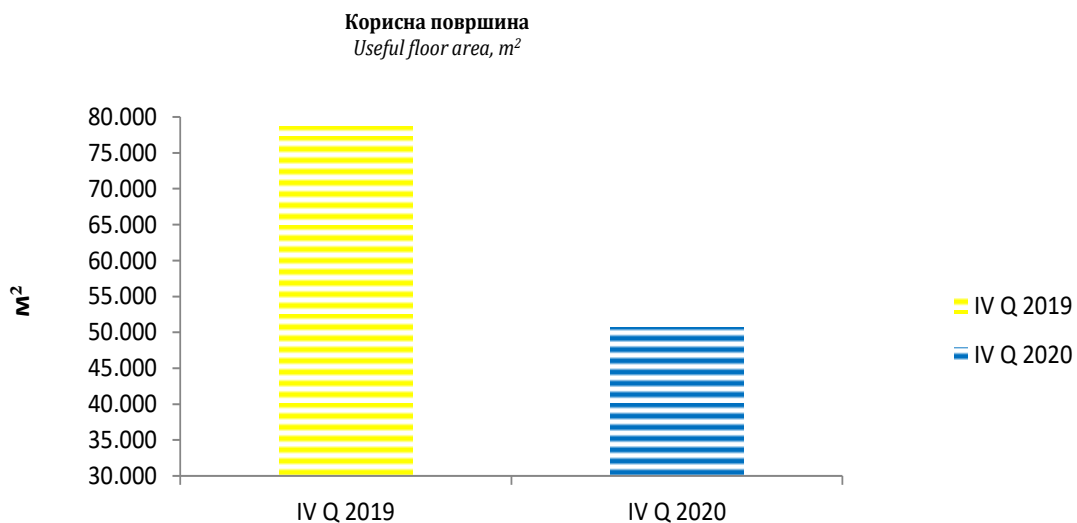
Figure 2: USEFUL AREA OF SOLD NEW DWELLINGS, 2019 AND 2020