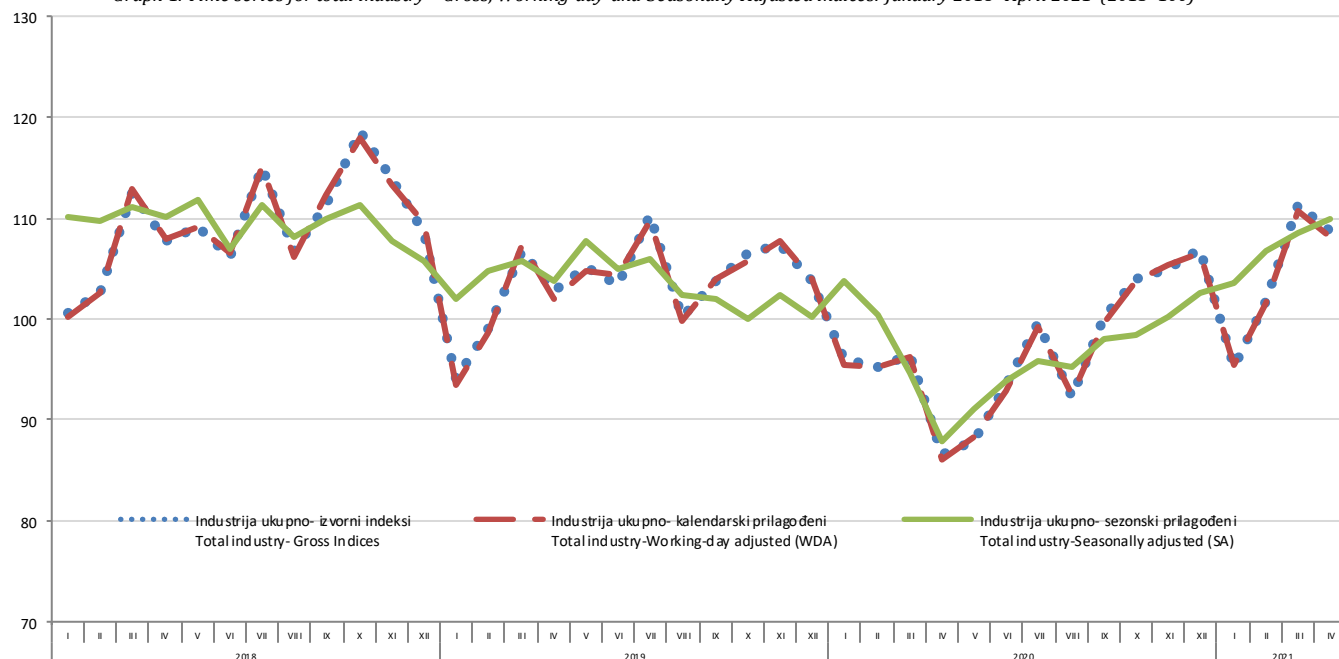
Grafik 1. Vremenska serija industrija ukupno - izvorni, kalendarski i sezonski prilagođeni indeksi: siječanj 2018. - travanj 2021. (2015=100) Graph 1. Time series for total industry - Gross, Working-day and Seasonally Adjusted indices: January 2018 - April 2021 (2015=100)

In April 2021, compared to April 2020, industrial production in Bosnia and Herzegovina, the calendar adjusted, is increased by 25.5%.