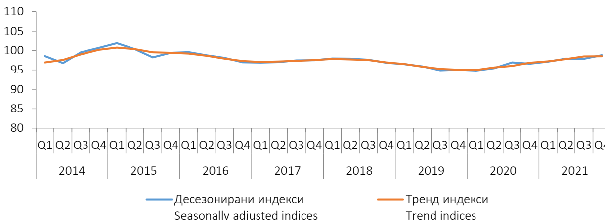
Графикон 1. Индекси производње у грађевинарству у БИХ, I Q 2014. - IV Q 2021. Graph 1. Indices of production in construction in BIH, I Q 2014 - IV Q 2021