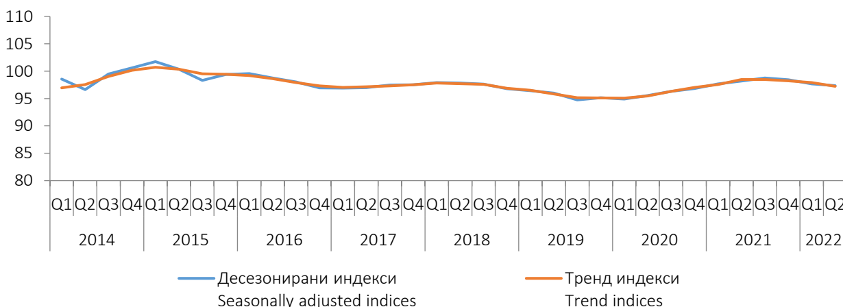
Графикон 1. Индекси производње у грађевинарству у БИХ, I Q 2014. - II Q 2022. Graph 1. Indices of production in construction in BIH, I Q 2014 - II Q 2022