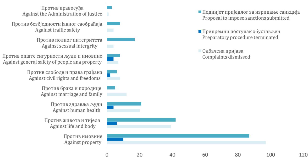
Графикон 2. Оптужена малољетна лица према групи кривичних дјела, 2021. година Graph 2. Accused juvenile persons by group of criminal offences, year 2021