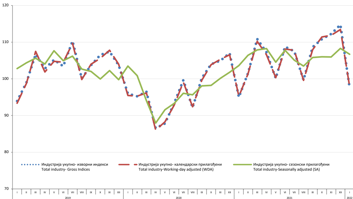
График 1. Временска серија индустрија укупно - изворни, календарски и сезонски прилагођени индекси: јануар 2019 - јануар 2022 (2015 = 100) Graph 1. Time series for total industry - Gross, Working-day and Seasonally Adjusted indices: January 2019 - January 2022 (2015=100)