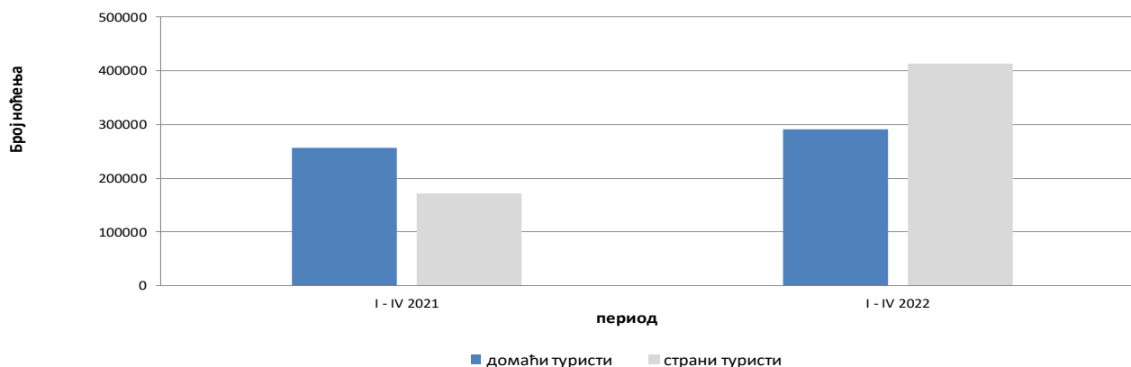
Ноћења туриста у периоду од јануара до априла 2021. и 2022.

Према врсти смјештајног објекта највећи број ноћења остварен је у оквиру дјелатности Хотели и сличан смјештај са учешћем од 94,4%.