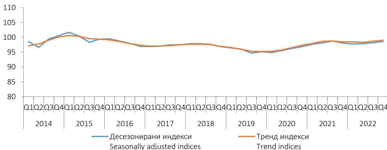
Графикон 1. Индекси производње у грађевинарству у БИХ, I Q 2014. - IV Q 2022. Graph 1. Indices of production in construction in BiH, I Q 2014 - IV Q 2022