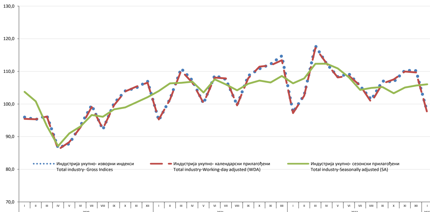
График 1. Временска серија индустрија укупно - изворни, календарски и сезонски прилагођени индекси: јануар 2020 - јануар 2023 (2015 = 100) Graph 1. Time series for total industry - Gross, Working-day and Seasonally Adjusted indices: January 2020 - January 2023 (2015=100)

In January 2023, compared to January 2022, industrial production in Bosnia and Herzegovina, the calendar adjusted, is increased by 0.1%.