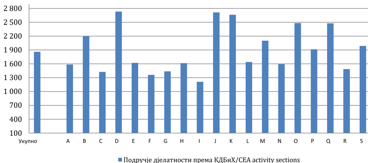
Графикон 1. Просјечне мјесечне бруто плате за јануар 2023. године према КДБиХ Graph 1. Average monthly gross wages, according to CEA, January 2023