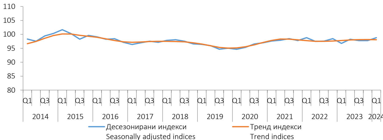
Графикон 1. Индекси производње у грађевинарству у БИХ, I Q 2014. - I Q 2024. Graph 1. Indices of production in construction in BiH, I Q 2014 - I Q 2024