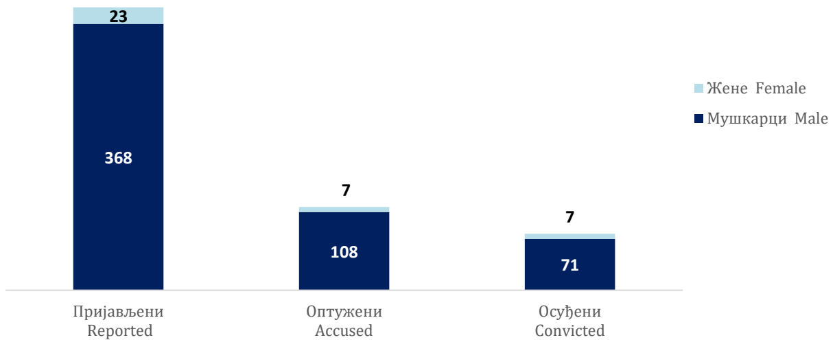
Графикон 1. Малољетни починиоци кривичних дјела у БиХ – пријављени, оптужени и осуђени, 2023. година Graph 1. Juvenile perpetrators of criminal offences in BiH- reported, accused and convicted, year 2023