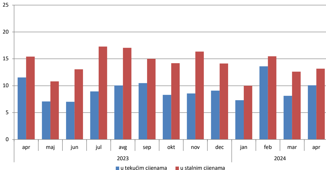
Godišnje stope promjene trgovine na malo, kalendarski prilagođena serija BiH

U odnosu na bazu (2021.) godinu, realni indeks prometa prehrambenih proizvoda u aprilu 2024. godine ostvario je rast od 23,1%, dok je promet neprehrambenim proizvodima ostvario rast od 66,1%. Promet od trgovine na malo motornim gorivima ostvario je rast od 23,5%. Dati podaci su desezonirani.