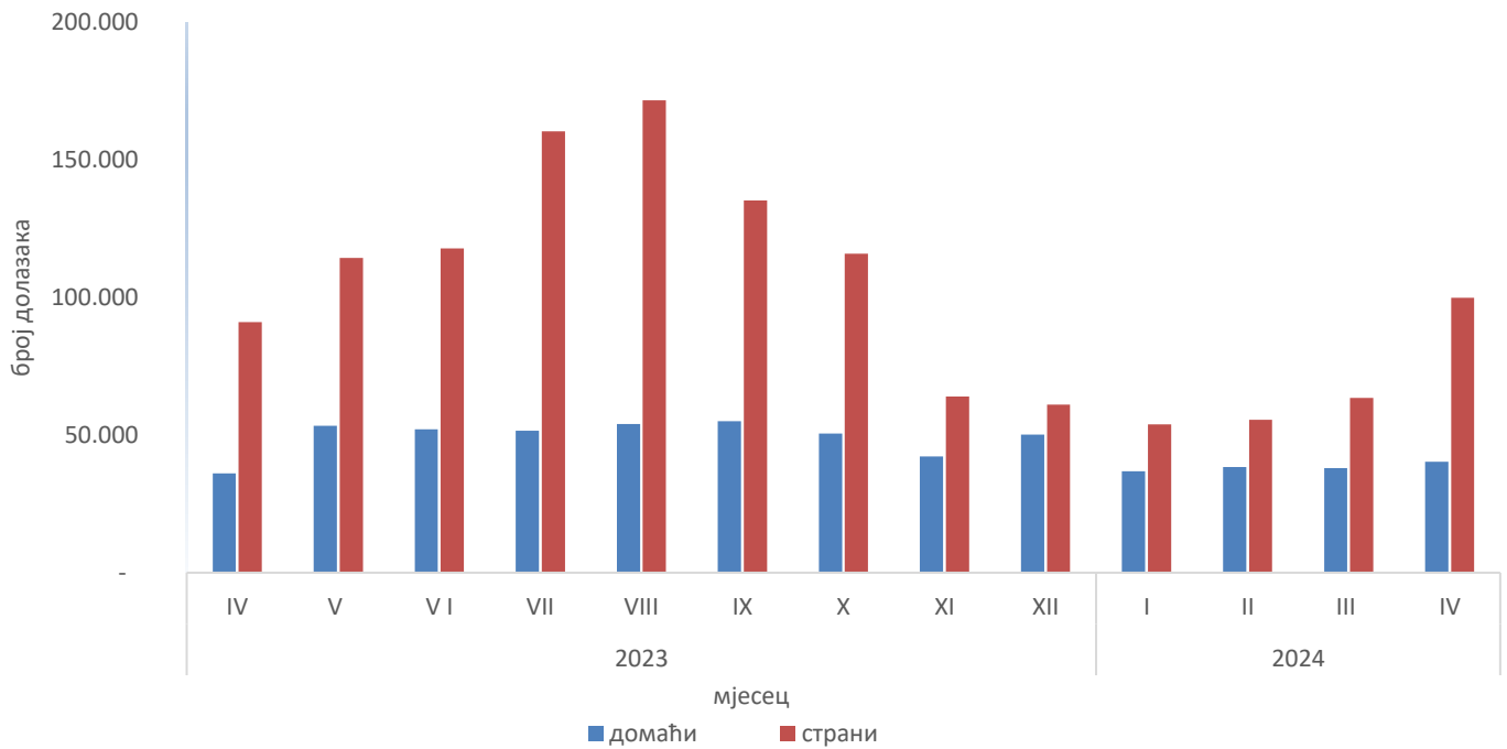
Графикон 2: Доласци туриста за период мај 2023 - мај 2024

Што се тиче дужине боравка страних туриста у нашој земљи, на првом мјесту су туристи из Новог Зеланда са 3,8 ноћења, Катар са 3,7 ноћења, Ирска и Украјина са по 3,4 ноћења и Малта и Египат са по 3,3 ноћења у просјеку.