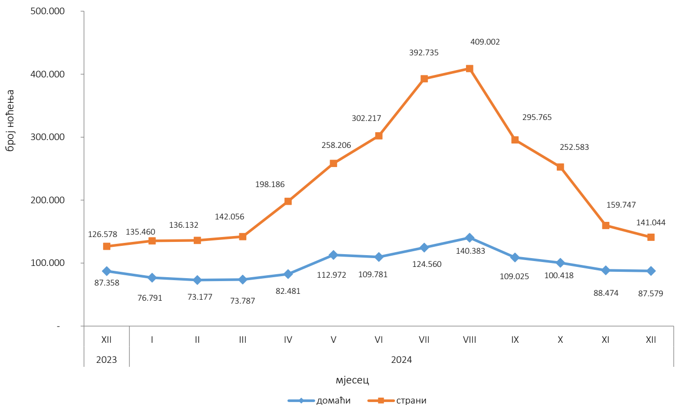
Графикон 1: Ноћења туриста за период децембар 2023. - децембар 2024.

Нето стопа искориштености соба у децембру 2024. износила је 24,9%, а сталних кревета 17,9%, док је у децембру 2023. стопа искориштености соба износила 26,7%, а сталних кревета 18,0%. Према врсти смјештајног објекта највећи број ноћења остварен је у оквиру дјелатности Хотели и сличан смјештај са учешћем од 94,7%.