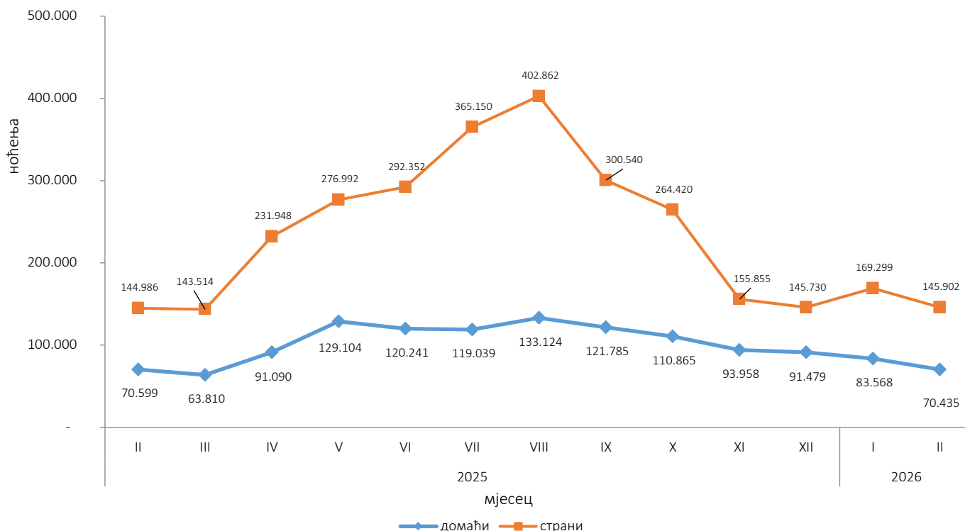
Графикон 1: Ноћења туриста за период фебруар 2025 – фебруар 2026.

Туристима је у фебруару 2026. године у Босни и Херцеговини било на располагању 19.606 соба, апартмана и мјеста за кампирање, са капацитетом од 44.293 кревета. У односу на фебруар 2025. године расположивост соба, апартмана и мјеста за кампирање била је мања за 2,2 %, док је број кревета био мањи за 3,1 %.